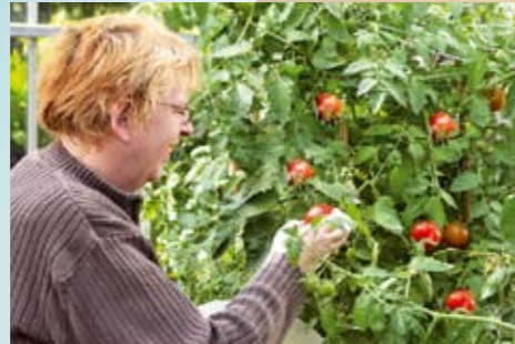
Arbeiten im Gewächshaus