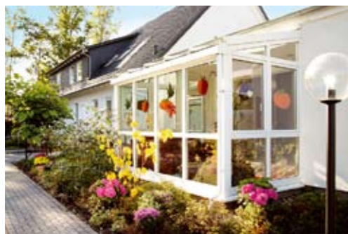
Haupthaus mit Wintergarten