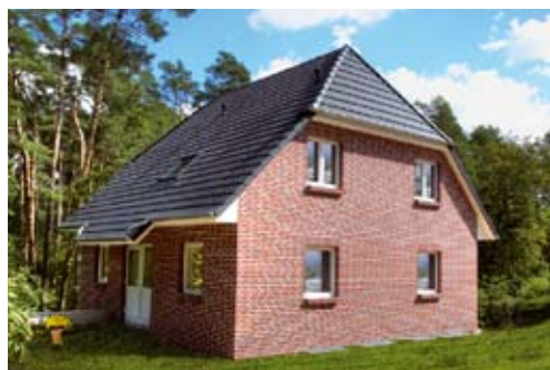
Haus „Hinter dem Hügel“