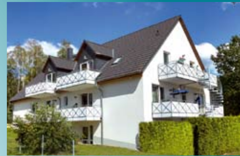
Apartment mit Terrasse oder Balkon